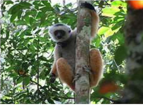
P. N. Andasibe-Mantadia