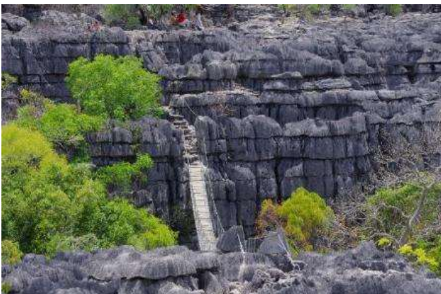
Tsingy gris d'Ankarana