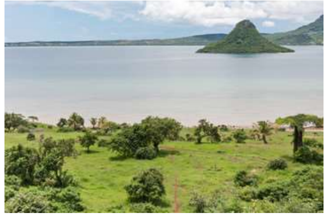
Badies de Diego Suárez