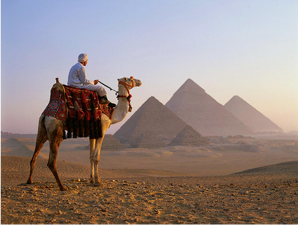
Piràmides de Gizah