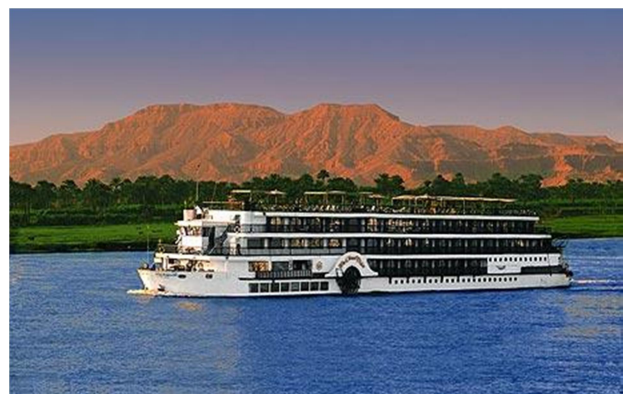
Creuer pel Nil