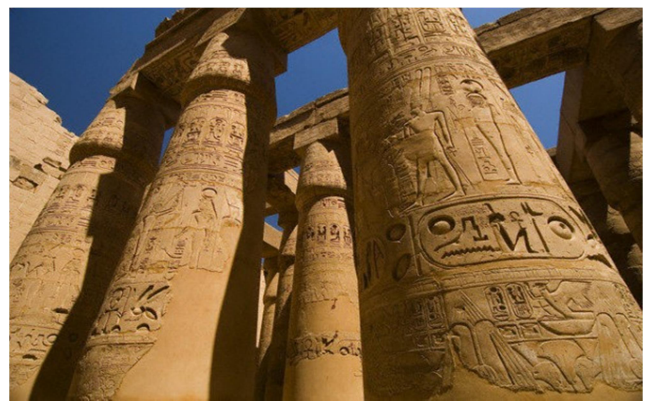
Temple de Karnak