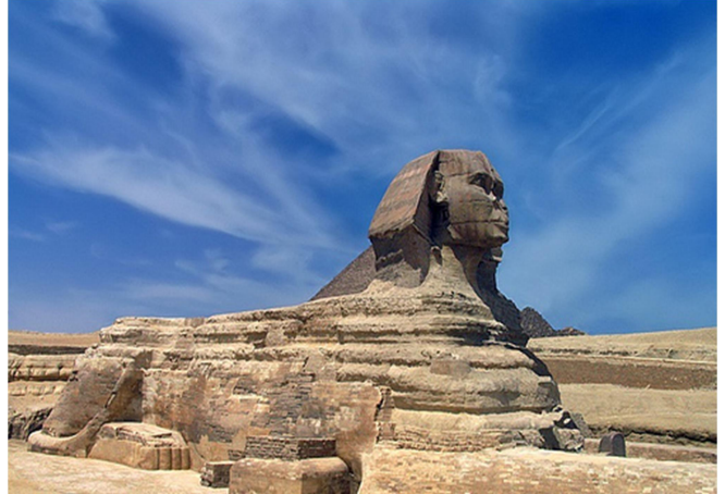
Esfinx de Gizah