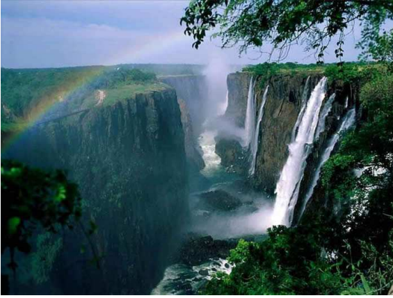
Cataratas Victoria desde Zambia