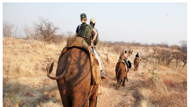
Excursiones y safaris