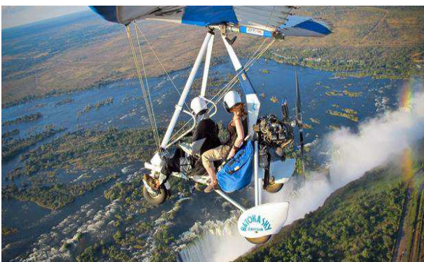
Volando sobre les catarates