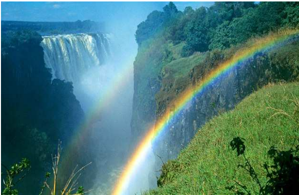
Cataratas Victoria desde Zimbabwe