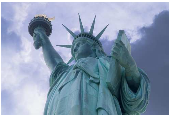
Estatua de la libertad