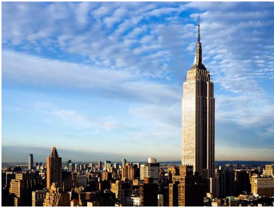
Empire State Buiding