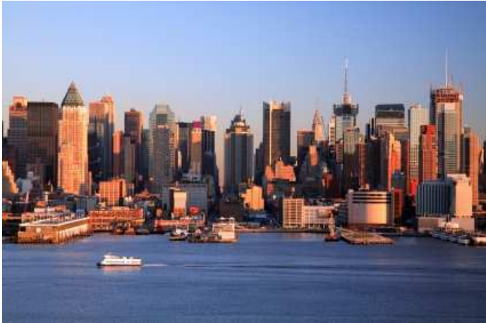
Nova York- Skyline