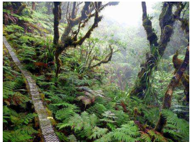
Senderismo por Molokai