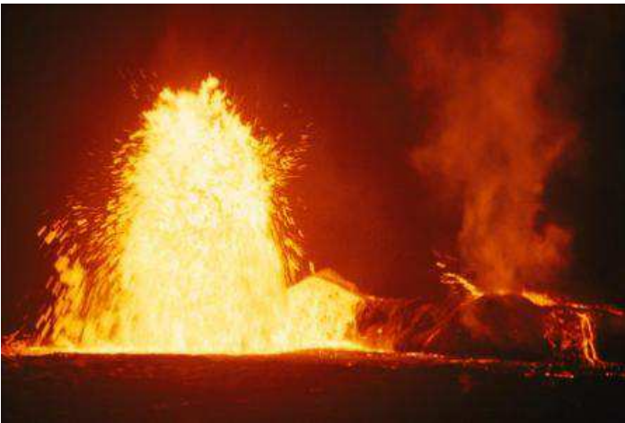
Volcan en la isla de Gran Hawaii