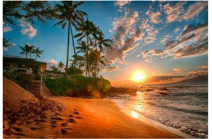
Isla de Gran Hawaii