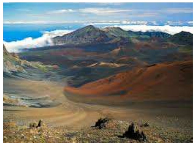
Paisaje volcánico en Maui