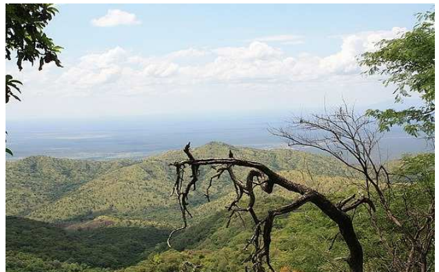
Parque Nacional de Mago