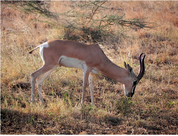
Parque Natural de Awash