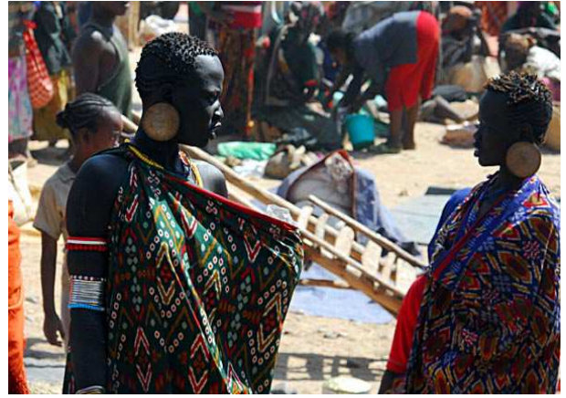
Jinka- Mujeres mursi