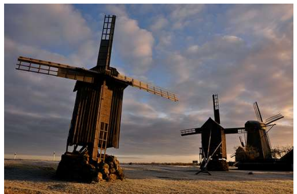
Isla de Saaremaa- Estonia