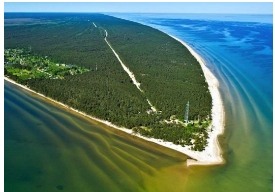
Cabo Kolka - Letonia