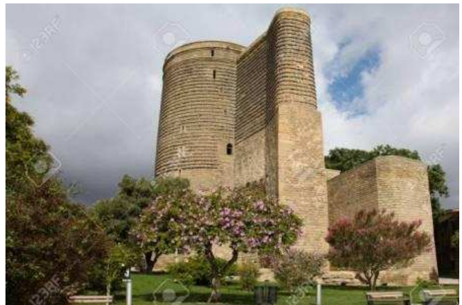
Torre de la Donzella, Bakú