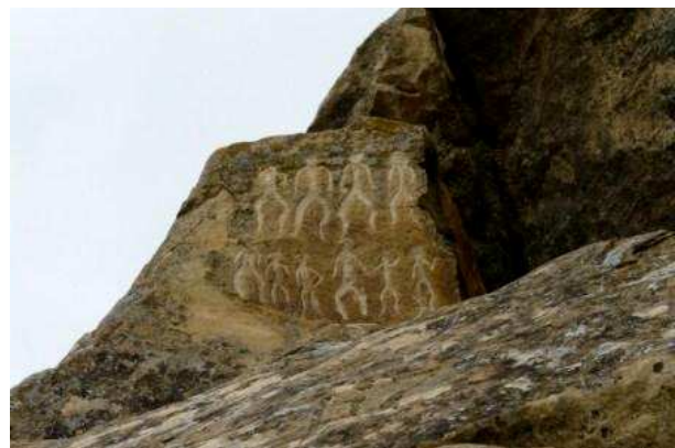
PN de Gobustan