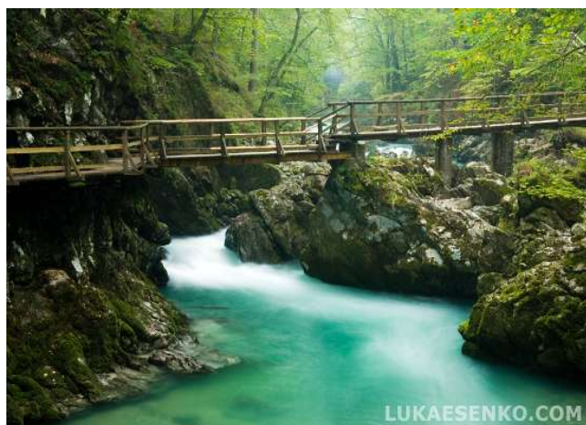
Gargantas del Vintgar (Bled)