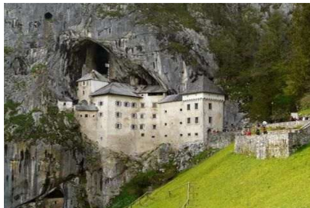
Castillo de Predjama