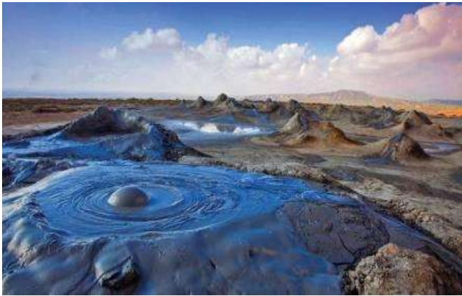
Volcanes en Gobustan National Park