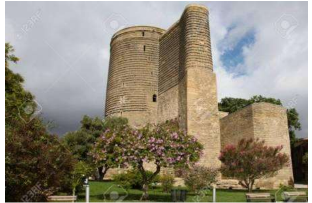
Torre de la Donzella, Bakú