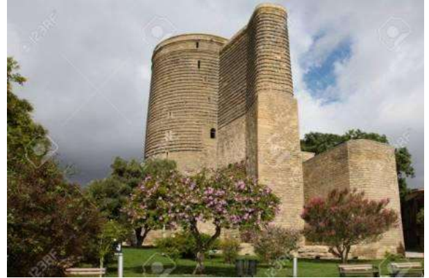
Torre de la Donzella, Bakú