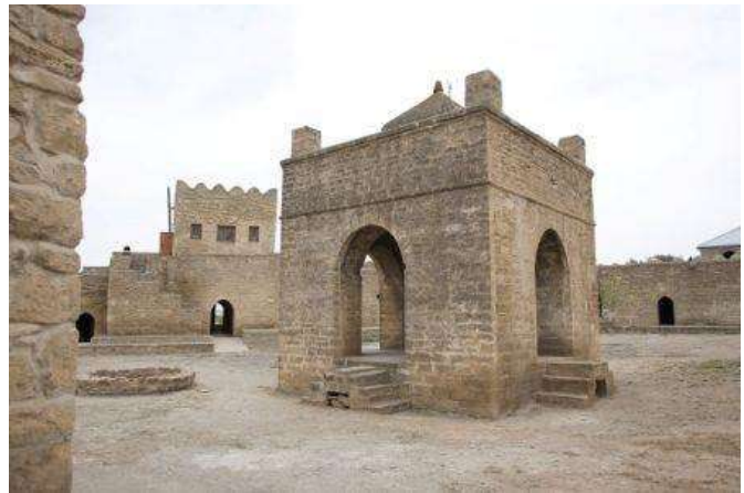
Temple del fuego de Ateshgah