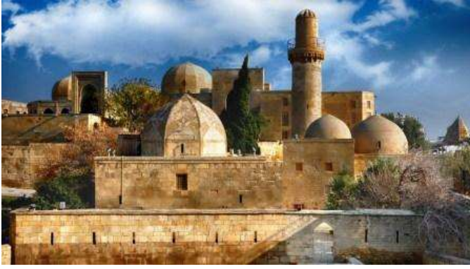
Shirvanshah palace, Bakú