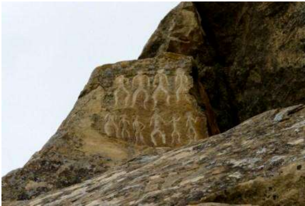
Volcanes en el Gobustan National Park