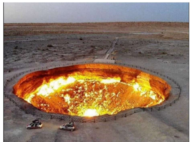
Cráter de Darvaza