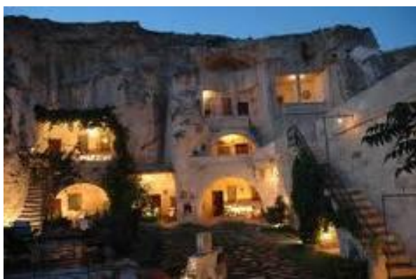
Viviendas en la Capadocia