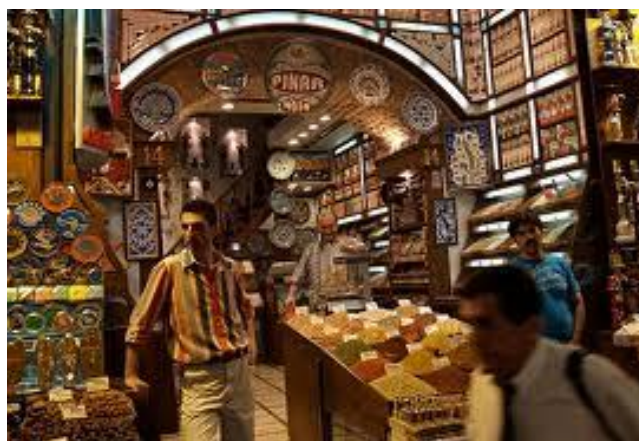
Estambul (Gran Bazar)