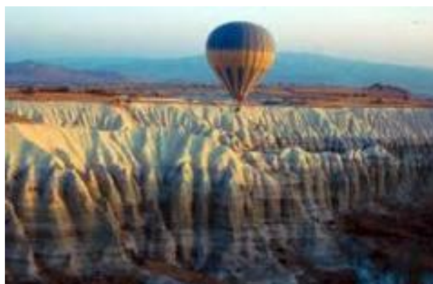
Viaje en globo por la Capadocia