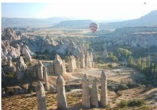
Paisaje de la Capadocia