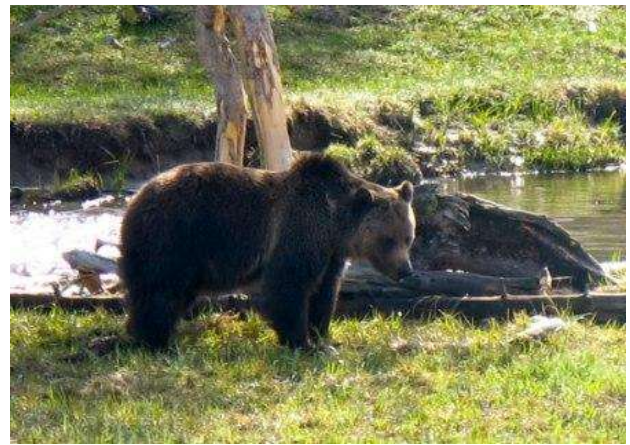
Osos en Yellowstone (Wyoming)