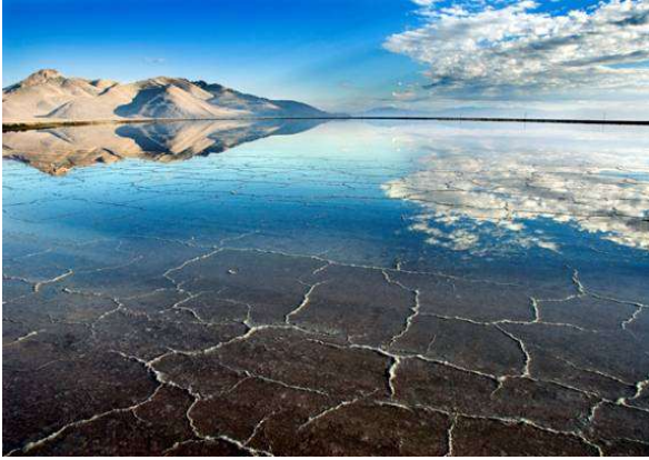
Gran Lago Salado (Utah)