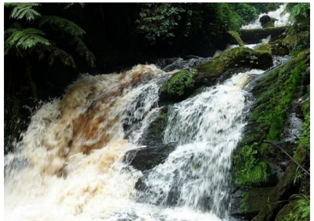
Isumo waterfalls en Nyungwe forest