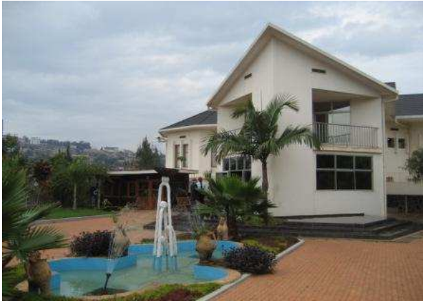
Gisozi Genocide Memorial