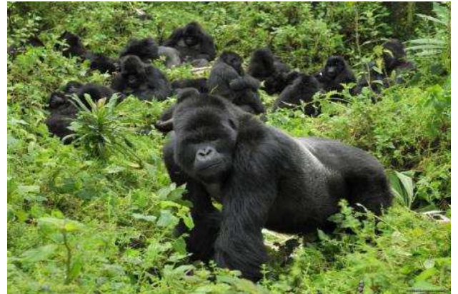
Nyungwe Forest y Volcanoes National Park