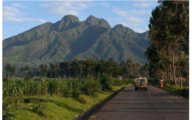
Volcanoes National park