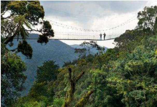
Canopy en Nyungwe Forest National Park