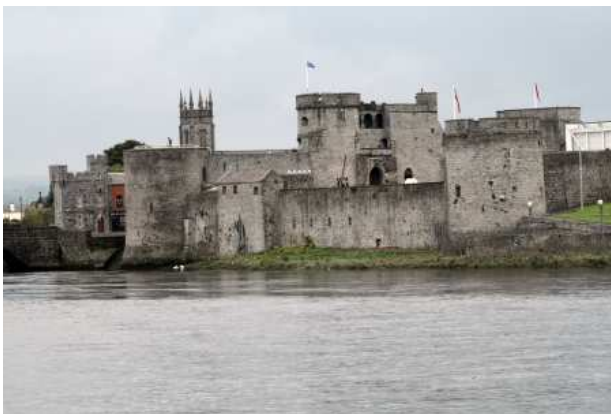
King John's Castle Limerick