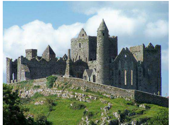
Rock of Cashel