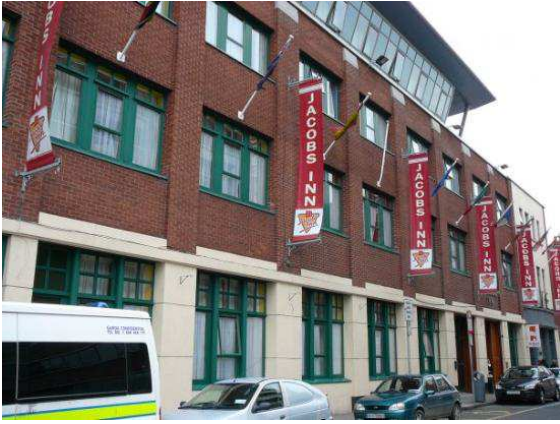
Jacobs Inn Hostel Dublin