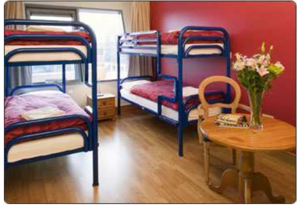
Jacobs Inn (habitació)