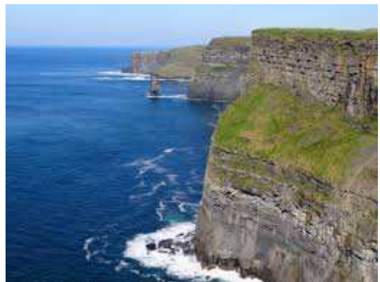
Cliffs of Cashel