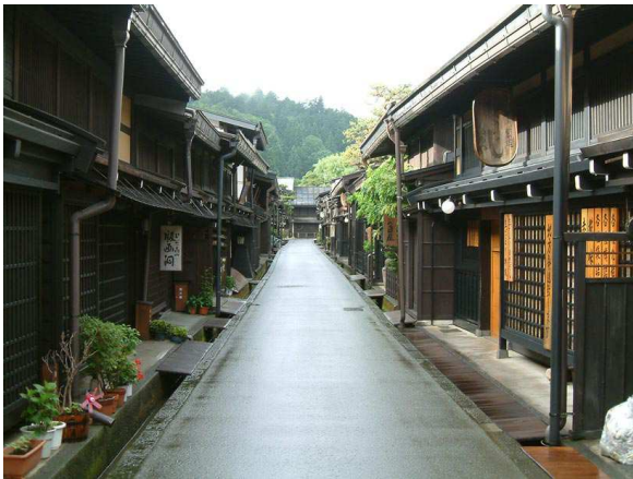
Poble medieval de Takayama